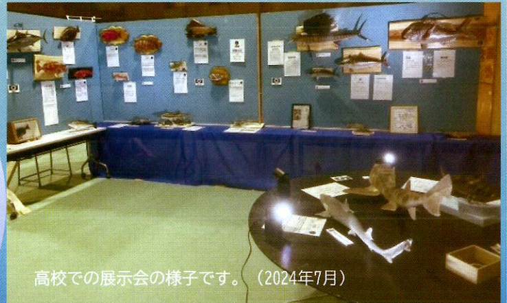
高校での展示会の様子です。（2024年7月）